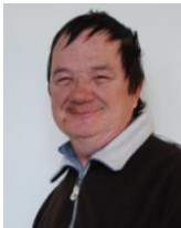
Franz Felber Haus Benedikt Tel.: 439